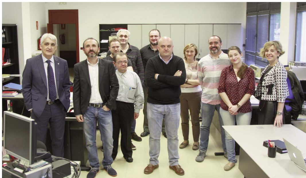
Posan para la foto los compañeros de la Oficina de Comunicación de la UR acompañados del rector y de la secretaria general.